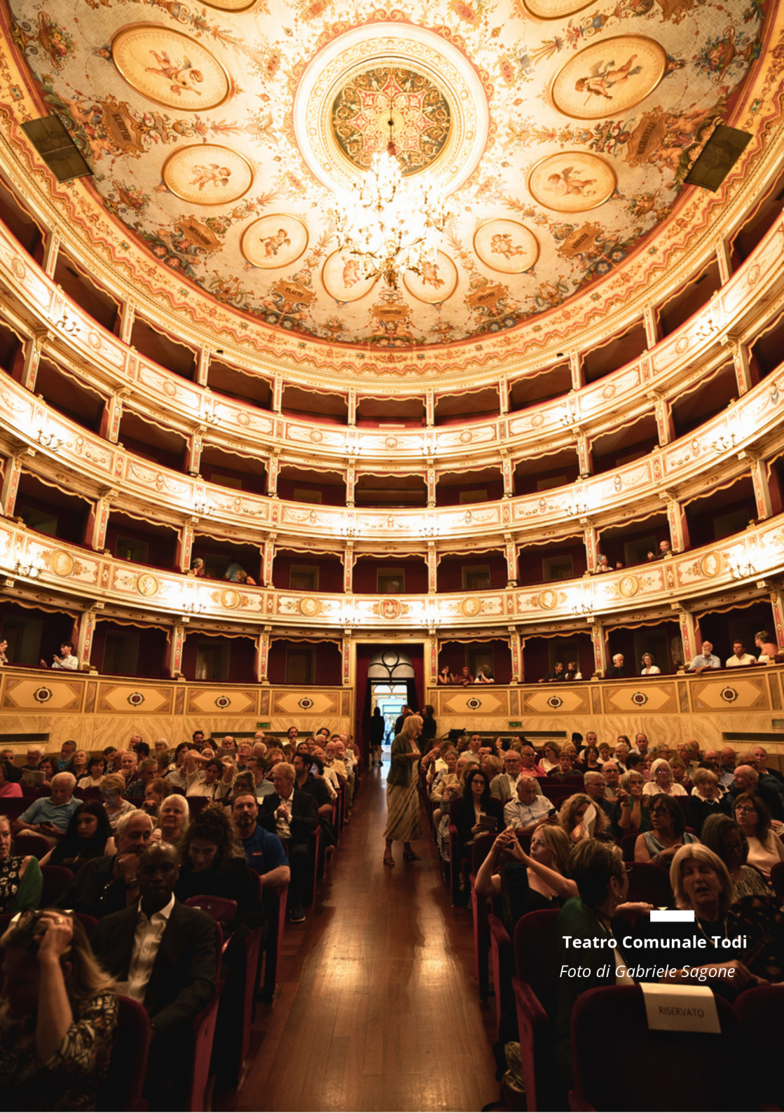
Teatro Comunale Todi